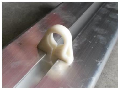
התקנת התפסן מתבצעת ע"י סיבוב התפסן ב-90 מעלות בתוך המסילה